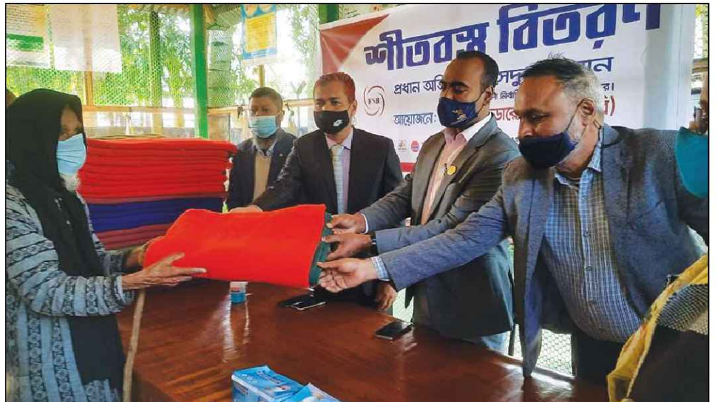
পঞ্চগড় জেলায় কম্বল বিতরণ করেন উপজেলা নির্বাহী কর্মকর্তা (সদর)