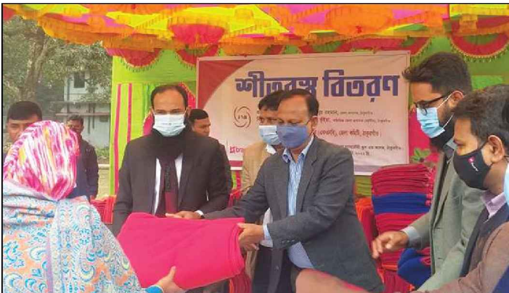
ঠাকুরগাঁও জেলায় কম্বল বিতরণ করেন অতিরিক্ত জেলা প্রশাসক (সার্বিক)