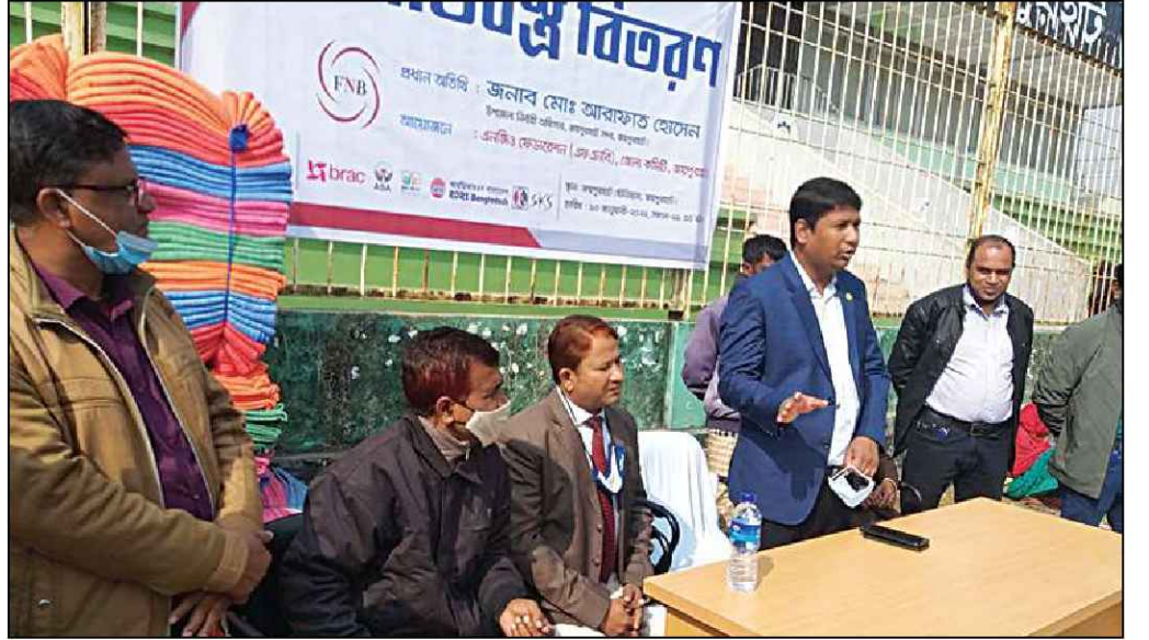
জয়পুরহাট জেলায় কম্বল বিতরণ করেন উপজেলা নির্বাহী কর্মকর্তা (সদর)