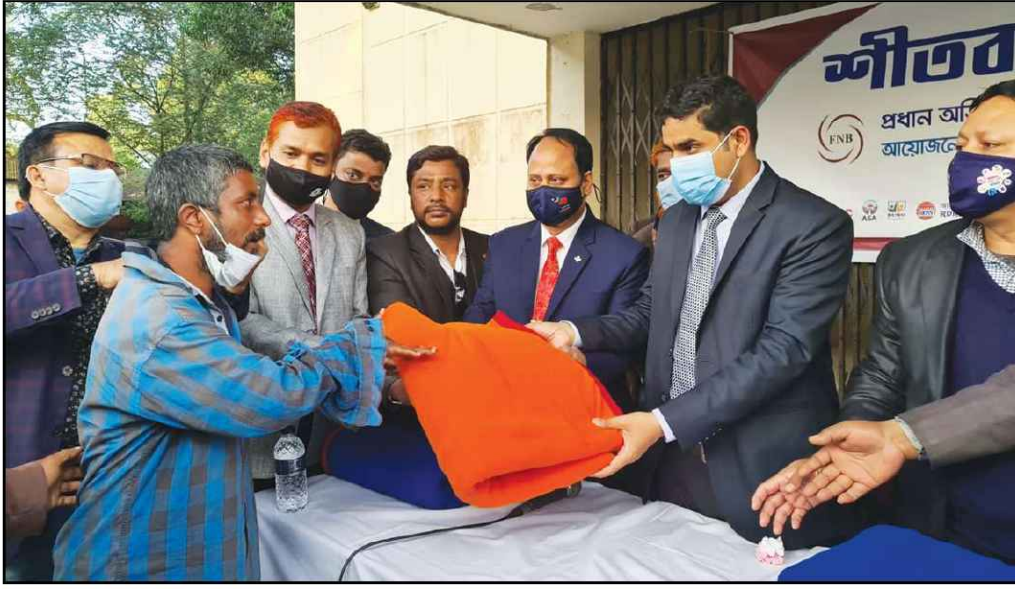
রংপুর জেলায় কম্বল বিতরণ করেন জেলা প্রশাসক