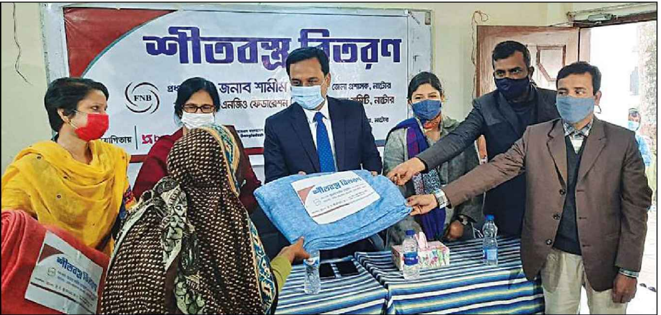
নাটোর জেলায় কম্বল বিতরণ করেন জেলা প্রশাসক

প্রশাসনের উচ্চ পর্যায়ের কর্মকর্তাবৃন্দ (জেলা প্রশাসক, অতিরিক্ত জেলা প্রশাসক, পুলিশ সুপার, উপপরিচালক-সমাজসেবা অধিদপ্তর, উপজেলা নির্বাহী কর্মকর্তা) ও স্থানীয় সিভিল সোসাইটির নেতৃবৃন্দ উক্ত কম্বল বিতরণ অনুষ্ঠানগুলোতে সম্মানীয় অতিথি হিসেবে উপস্থিত ছিলেন। কম্বল বিতরণশেষে স্থানীয় ও জাতীয় ইলেকট্রনিক ও প্রিন্ট মিডিয়ায় এসংক্রান্ত প্রতিবেদন প্রকাশিত ও প্রচারিত হয়।