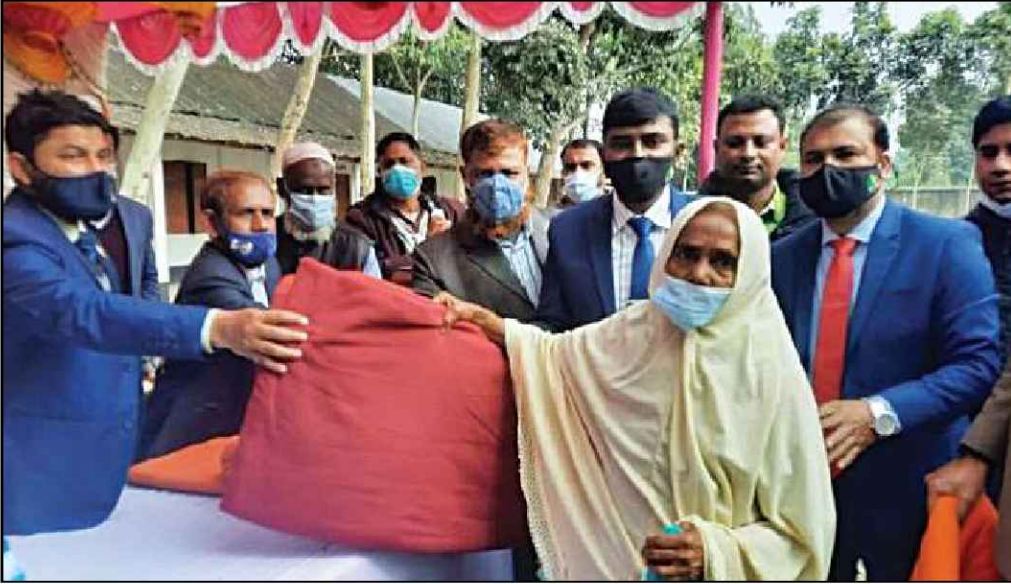
পঞ্চগড় জেলায় কম্বল বিতরণ করেন উপজেলা নির্বাহী কর্মকর্তা (সদর)