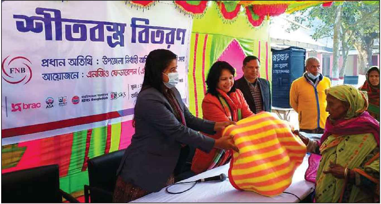
নীলফামারী জেলায় কম্বল বিতরণ করেন উপজেলা নির্বাহী কর্মকর্তা (সদর)