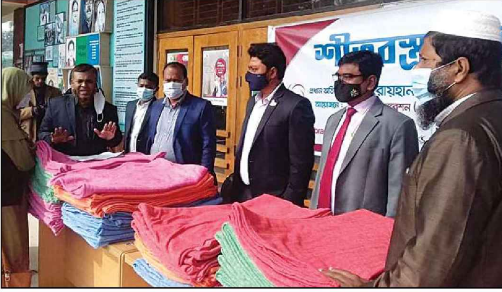
নওগাঁ জেলায় কম্বল বিতরণ করেন অতিরিক্ত জেলা প্রশাসক (সার্বিক)