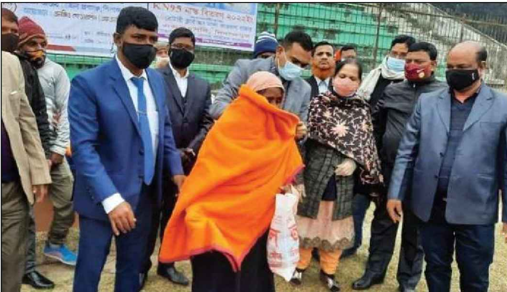
দিনাজপুর জেলায় কম্বল বিতরণ করছেন অতিরিক্ত জেলা প্রশাসক (সার্বিক)