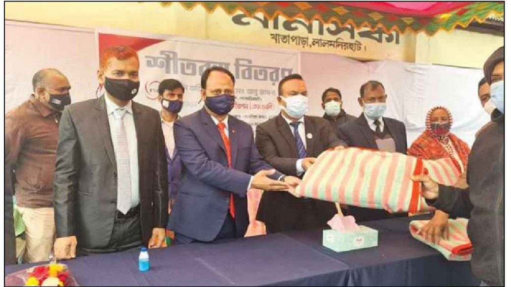
লালমনিরহাট জেলায় কম্বল বিতরণ করেন জেলা প্রশাসক