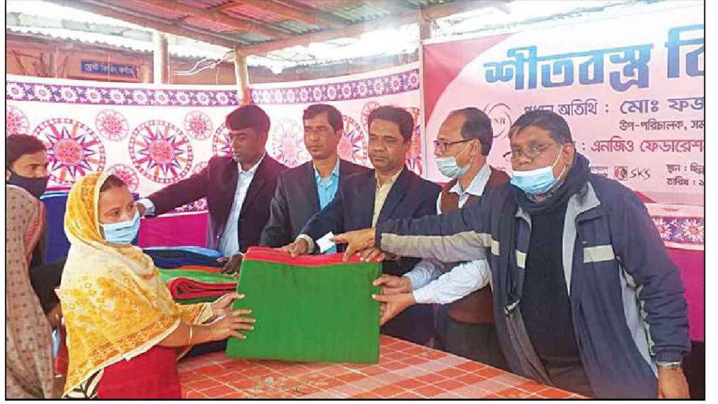
গাইবান্ধা জেলায় কম্বল বিতরণ করেন সমাজসেবা অধিদপ্তরের উপপরিচালক